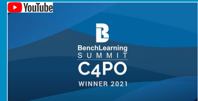
All Winners Announcement Video 2021

Die Verleihung des Awards bestärkt uns darin und ist gleichzeitig Ansporn für unser künftiges Handeln.“